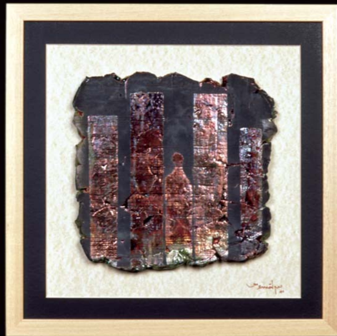
Tablet , 2001, h: 37cm., Raku - 1000° C.