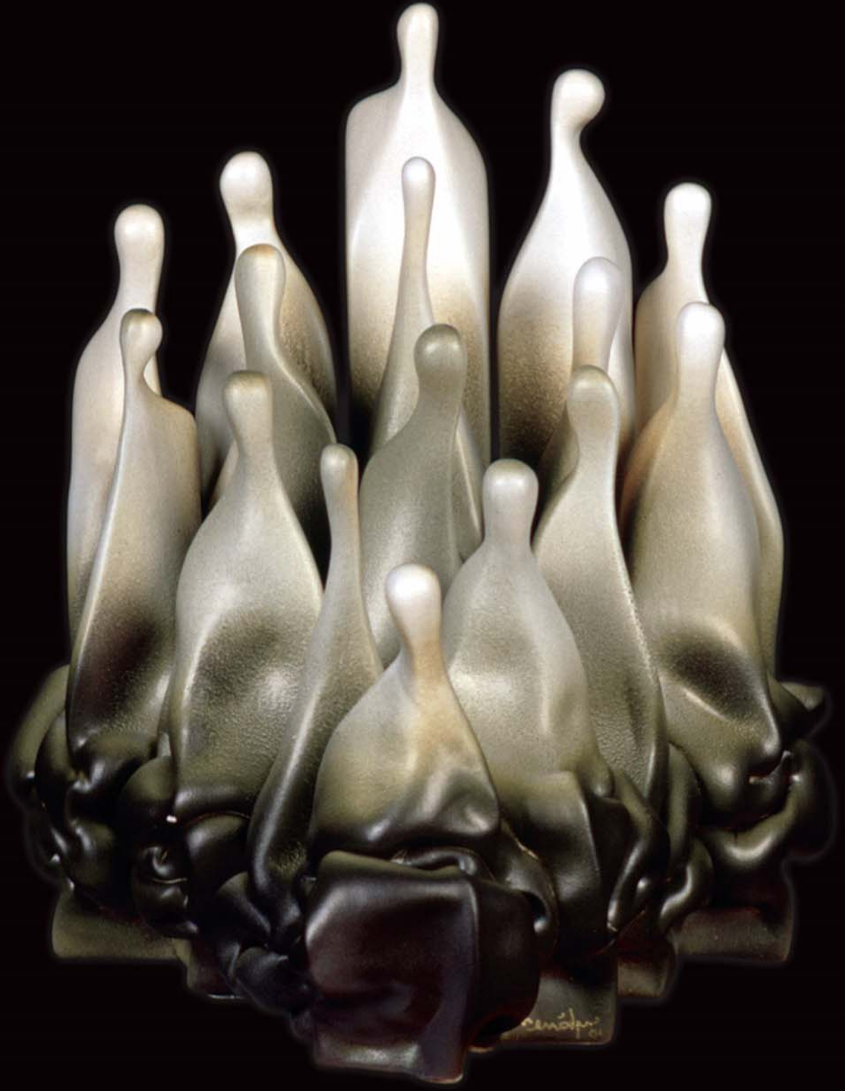
İnsan Yapıları , 2001, h: 30cm., Stoneware - 1200° C.