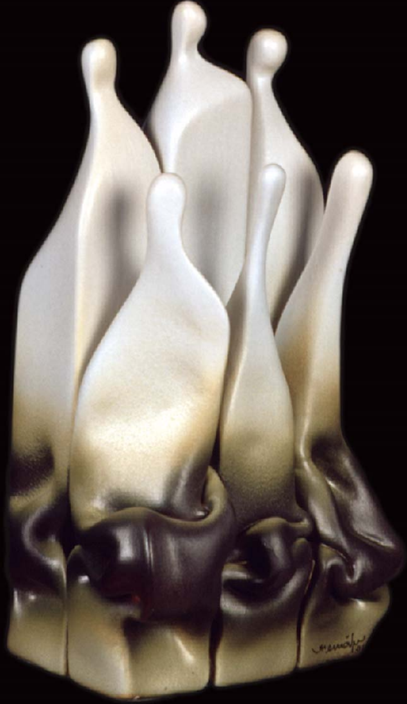
İnsan Yapıları , 2001, h: 30cm., Stoneware - 1200° C.