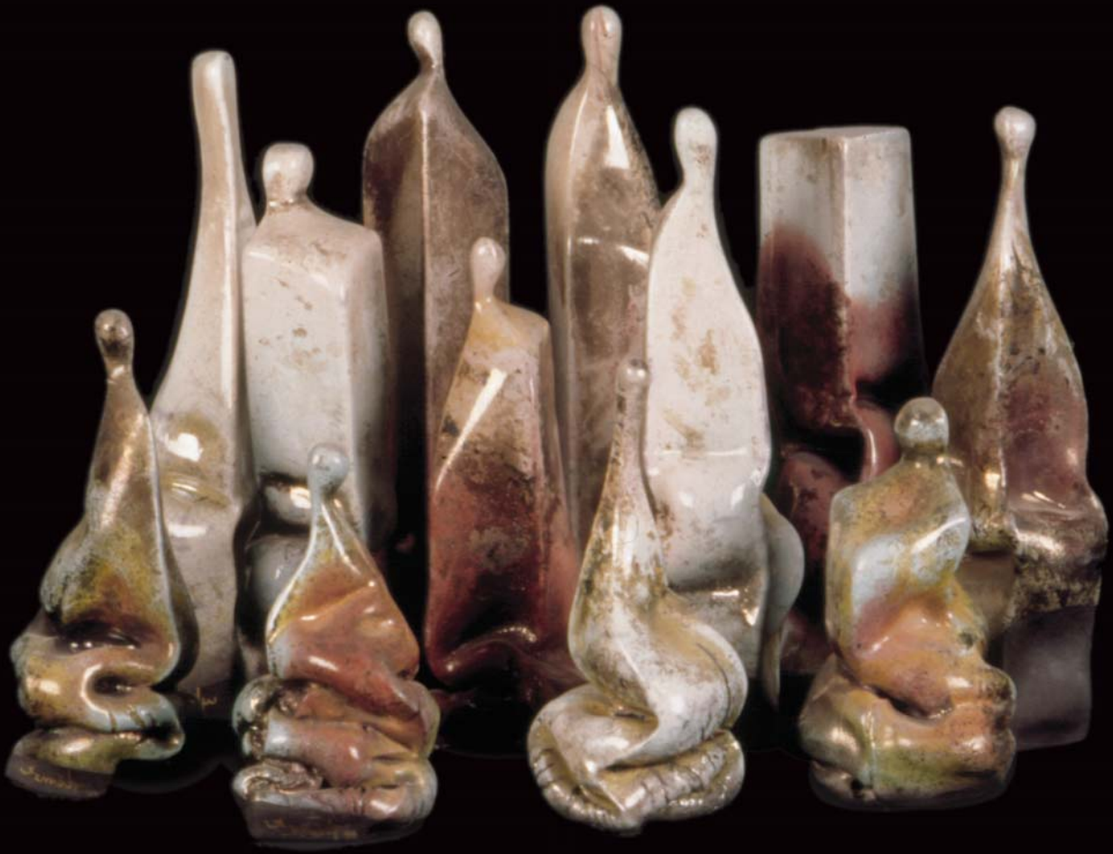
İnsanlar , 1999, h: 30cm., Raku - 1000° C.