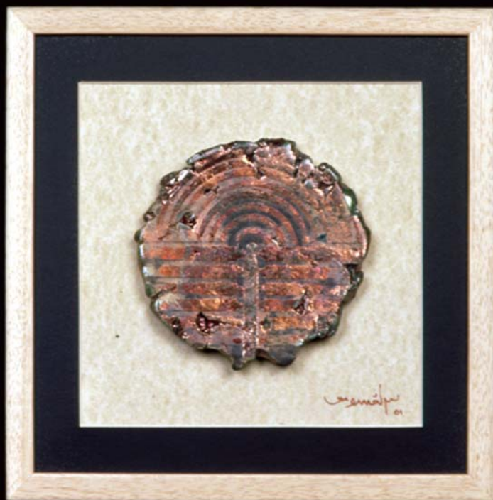
Tablet , 2001, h: 22cm., Raku - 1000° C.