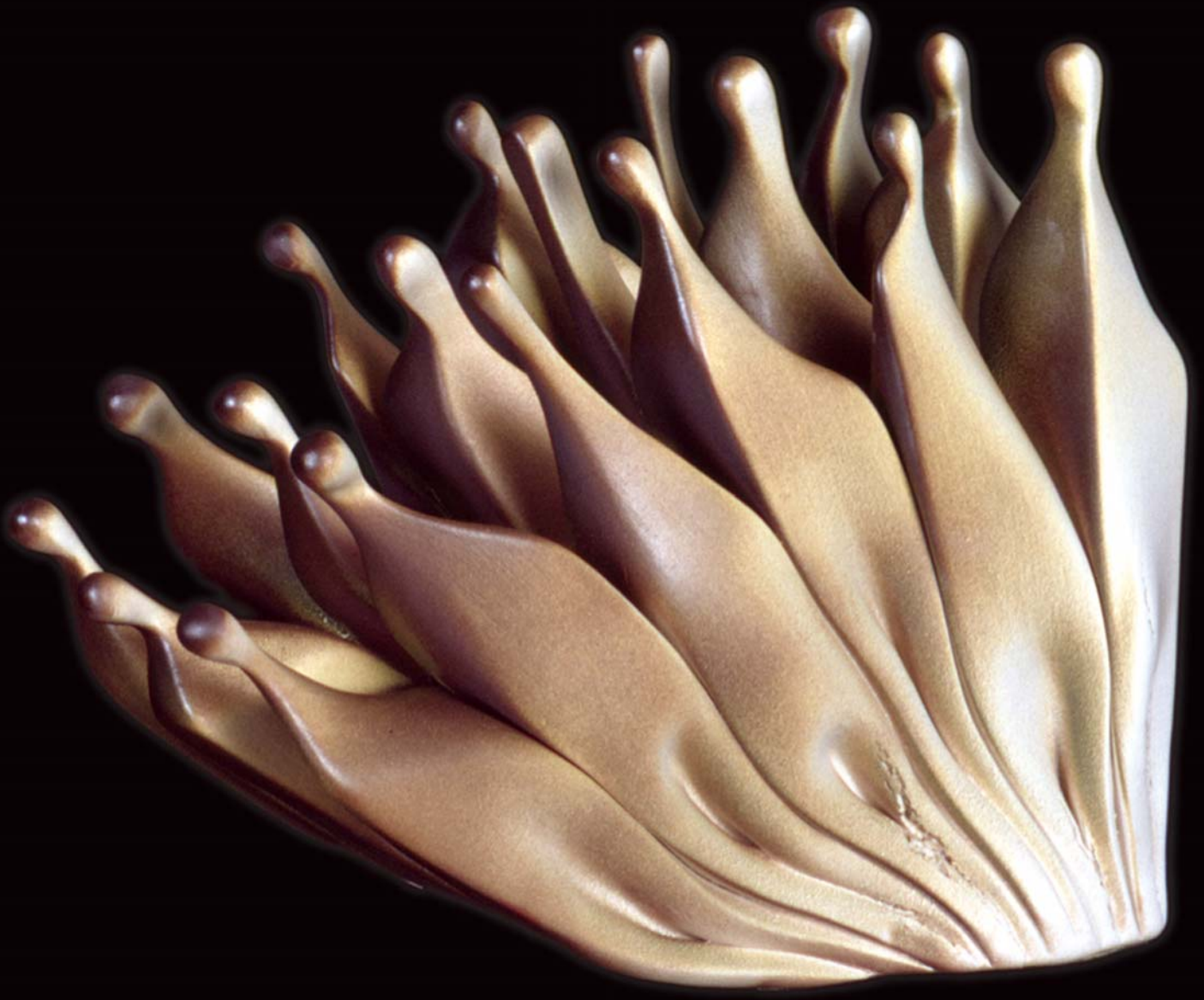
İnsan Yapıları , 2001, h: 25cm., Stoneware - 1200° C.