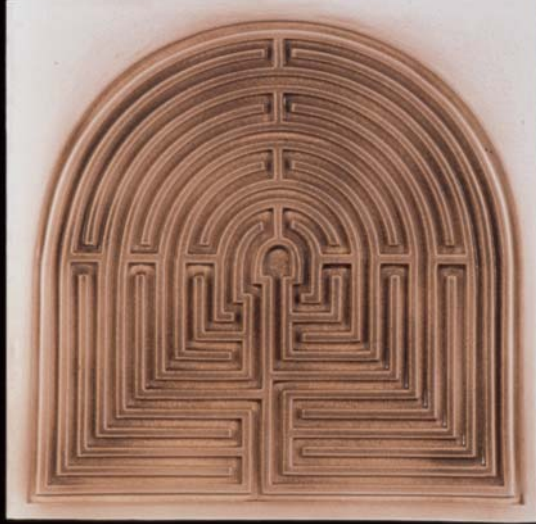
Tek Yön : Anadolu