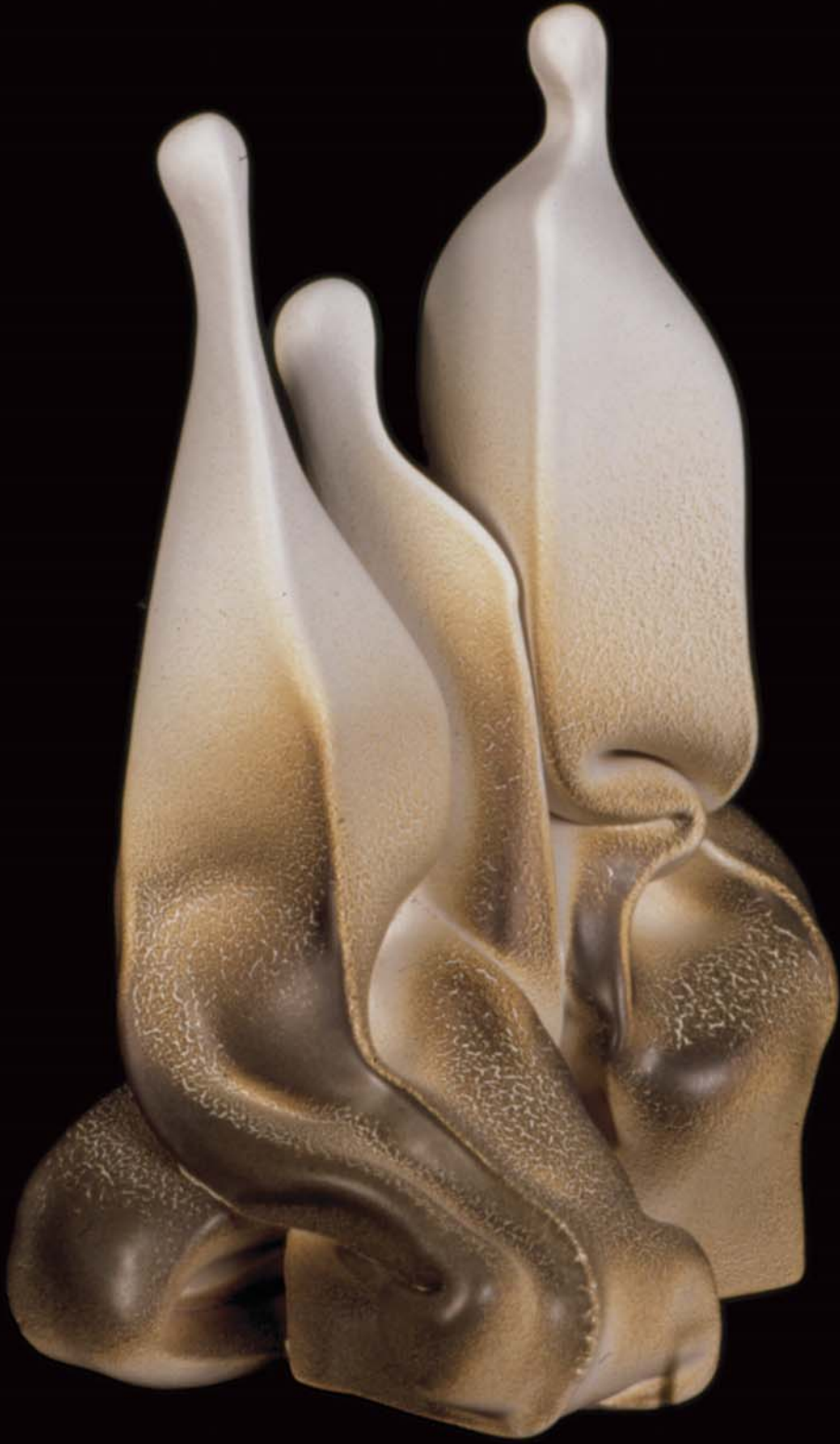
İnsan Yapıları , 2000, h: 26cm., Stoneware - 1200° C.