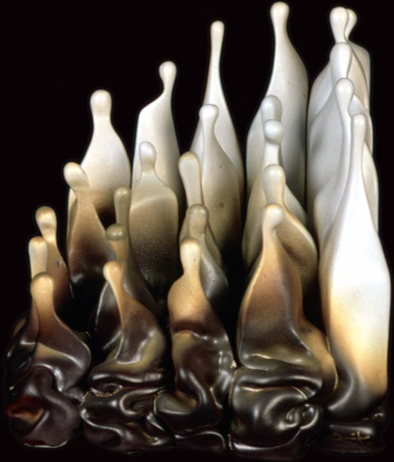
İnsan Yapıları , 2001, h: 30cm., Stoneware - 1200° C.