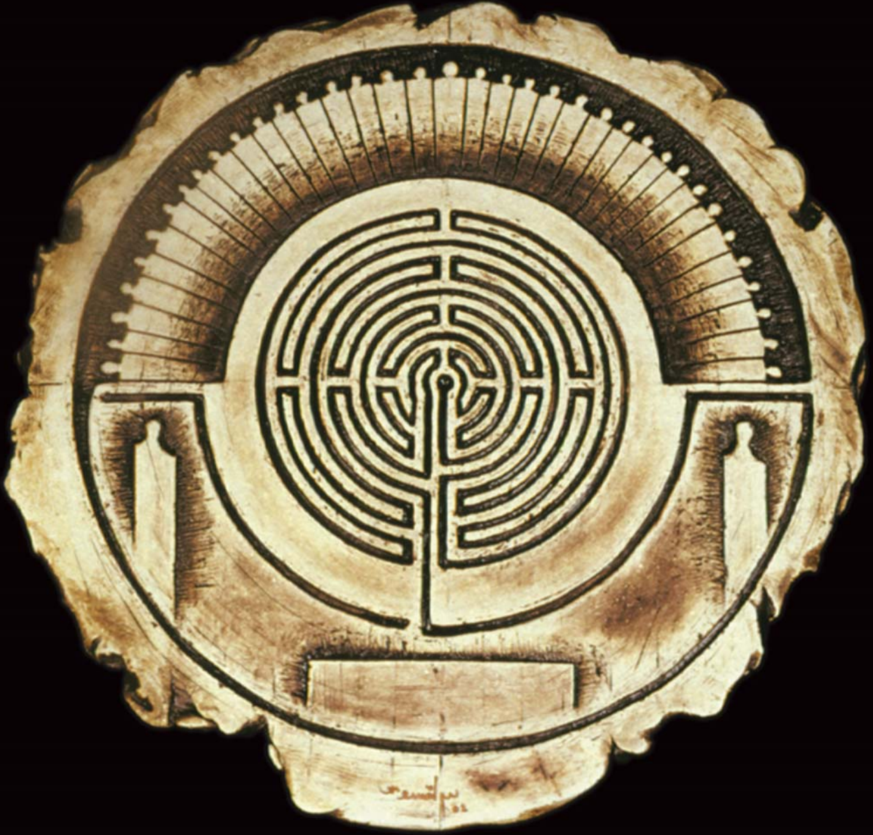
Küreselleşmenin İkonaları , 2002, h: 30cm., Stoneware - 1200° C.