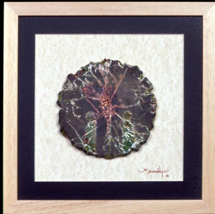
Tablet , 2000, h: 26cm., Raku - 1000° C.