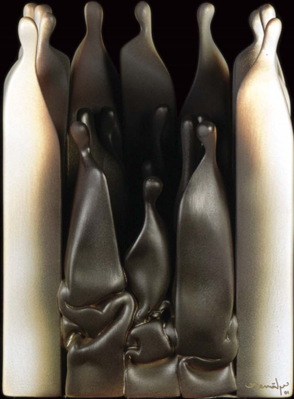
İnsan Yapıları , 2001, h: 30cm., Stoneware - 1200° C.