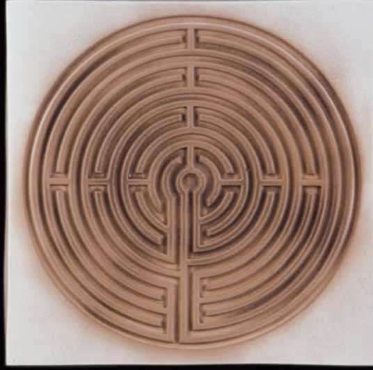
Tek Yön : Dođu