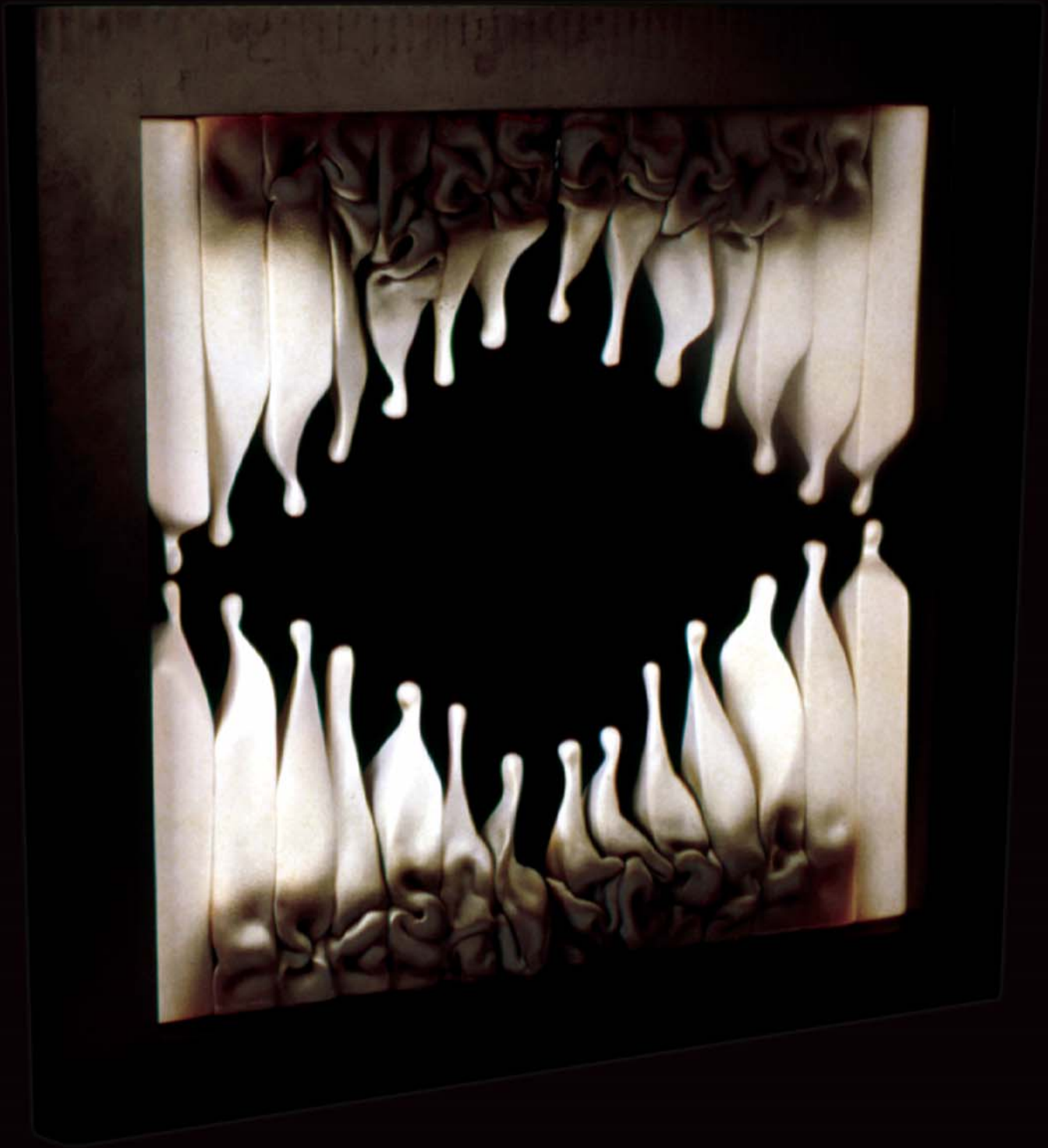
Yansima , 2001, h: 73cm., Stoneware - 1200° C.