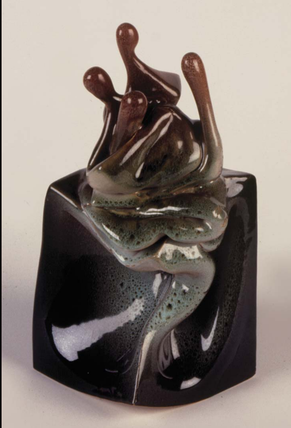
Tepdekiler , 1993, h: 30cm., Stoneware - 1200° C.