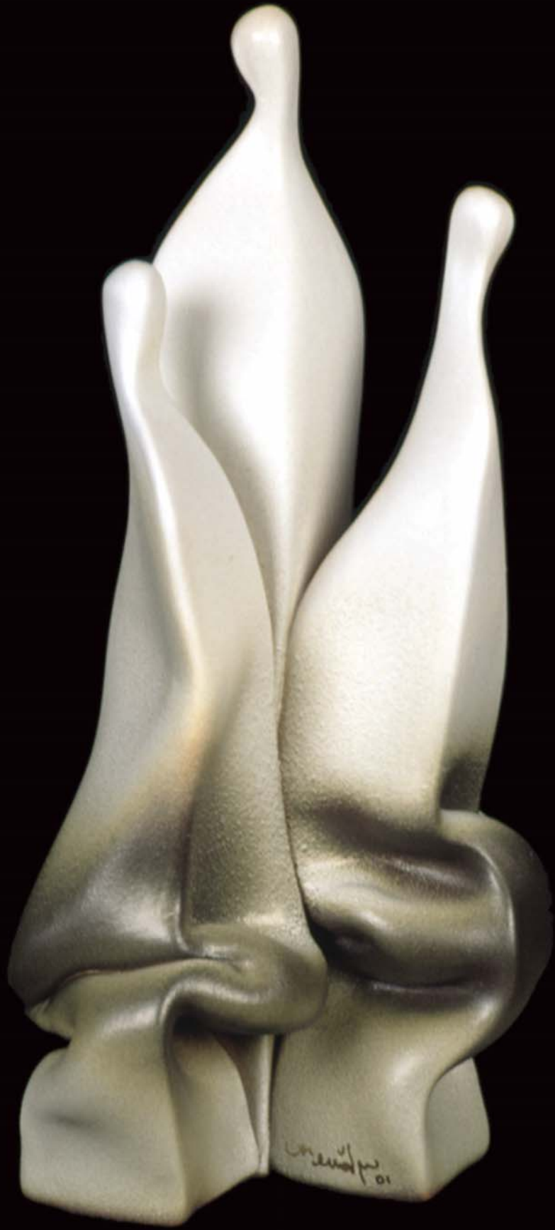
İnsan Yapıları , 2000, h: 30cm., Stoneware - 1200° C.