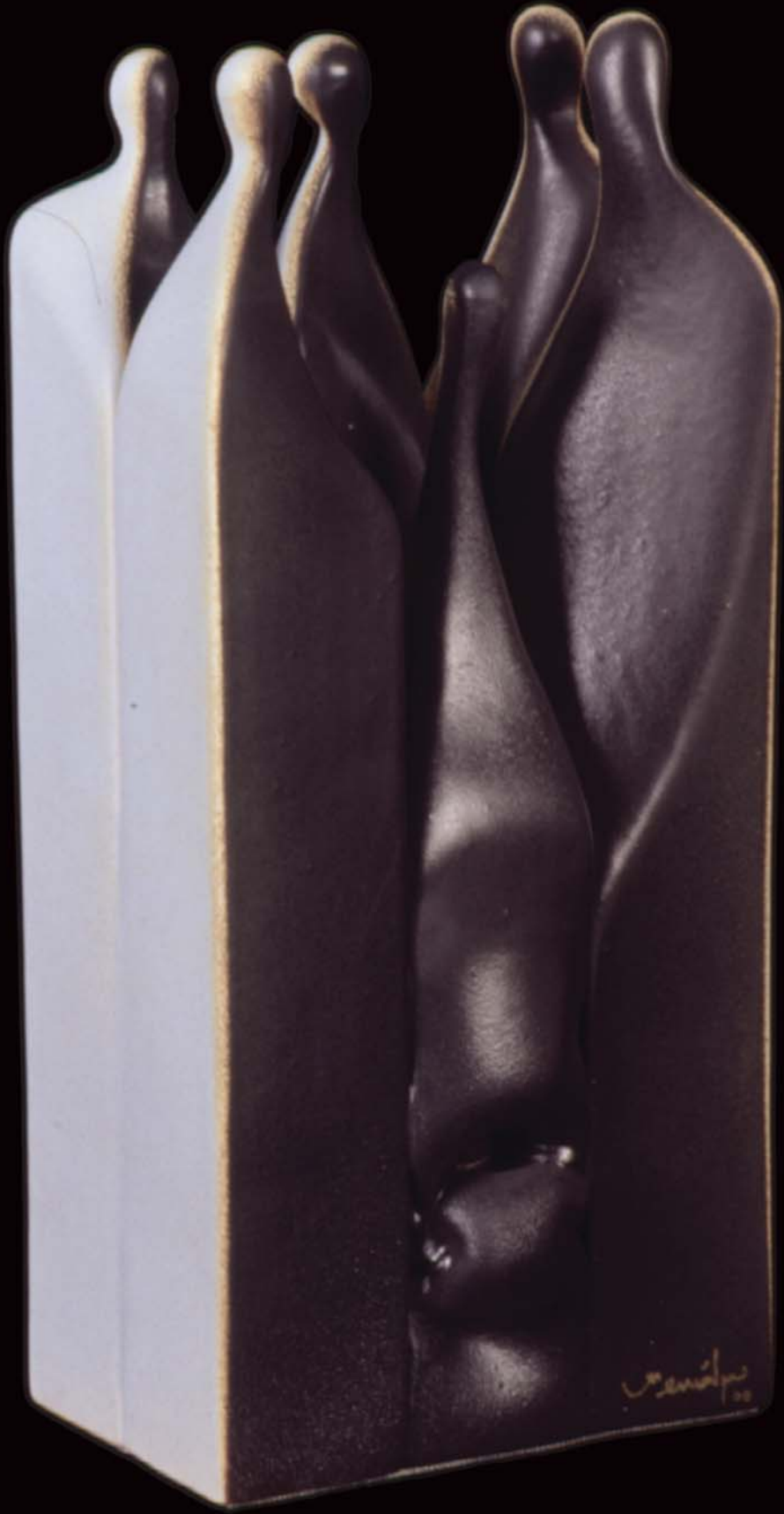
İnsan Yapıları , 2000, h: 30cm., Stoneware - 1200° C.