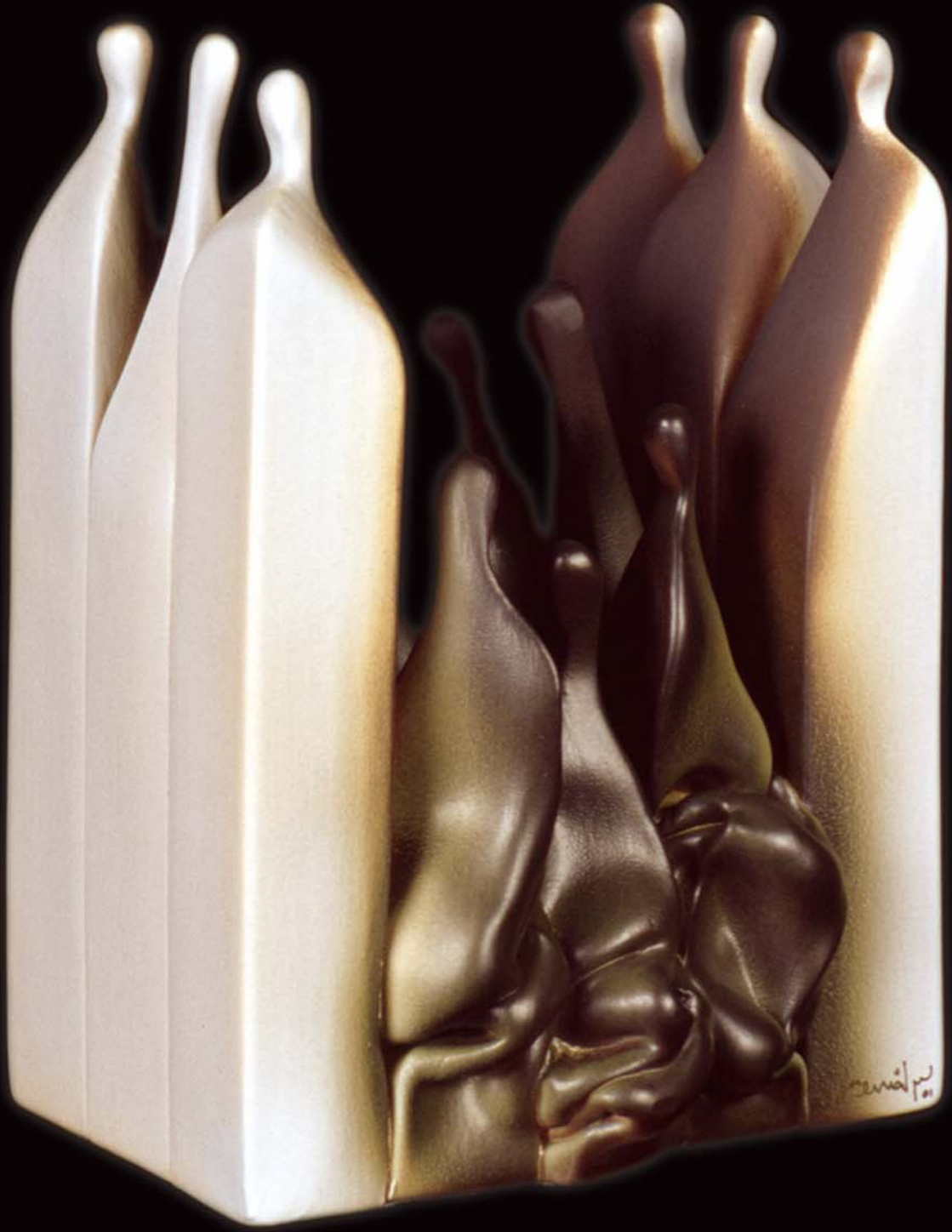
İnsan Yapıları , 2001, h: 30cm., Stoneware - 1200° C.