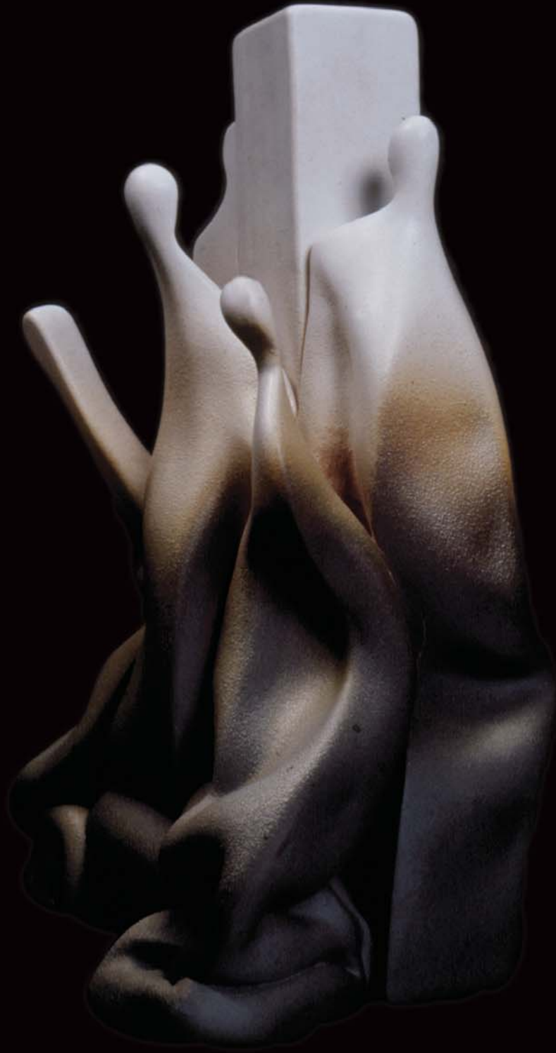
İnsan Yapıları , 2000, h: 30cm., Stoneware - 1200° C.